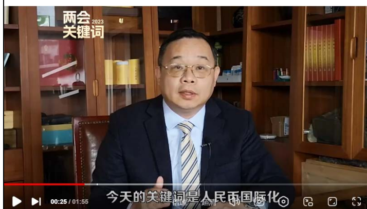
图 3 2023 年两会关键词之一“人民币国际化”

第三，观看视频《2023 年两会关键词-“人民币国际化”》（见图 3）了解人民币国际化基本内容，查找货币国际化的相关资料，思考什么是货币国际化？货币国际化的作用是什么？。