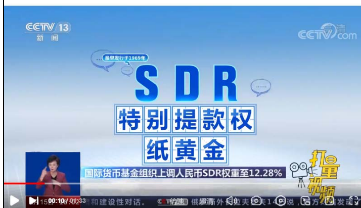
图 2 央视共同关注介绍“什么是 SDR”

第二，观看视频央视共同关注介绍“什么是 SDR”的视频（见图 2），查找特别提款权（SDR）的相关资料，了解什么是特别提款权、创设机构、作用等；